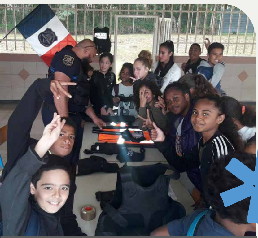
31 juillet - Forum des métiers au collège de Plum avec la police municipale