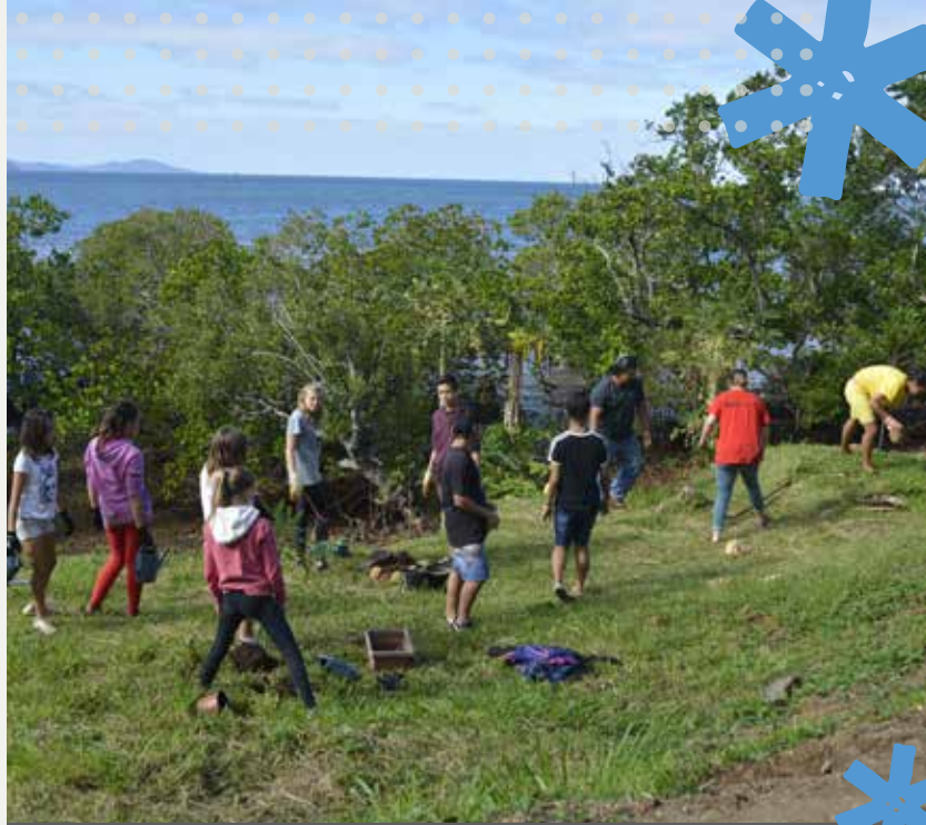
17 juillet - Plantation d'arbres sur la promenade du Mont-Dore Sud avec les élèves du collège de Plum et la délégation des îles Australes