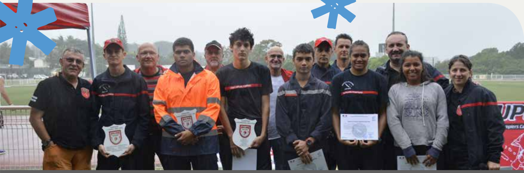
22 juillet - Olympiades des jeunes sapeurs-pompiers de Nouvelle-Calédonie