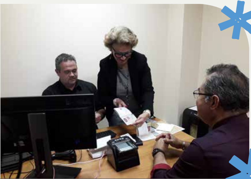
30 juillet - Ouverture du dispositif de recueil à la Mairie annexe de Plum