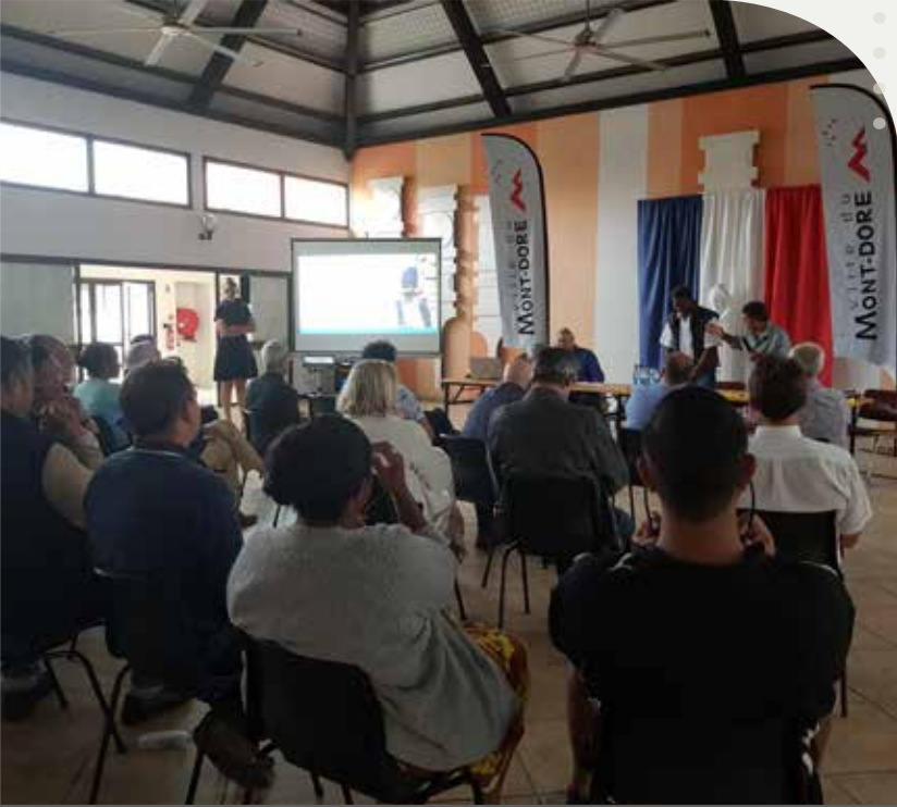
15 juillet - Présentation de l'enquête sur la jeunesse du Mont-Dore par le professeur Harvey Milkman