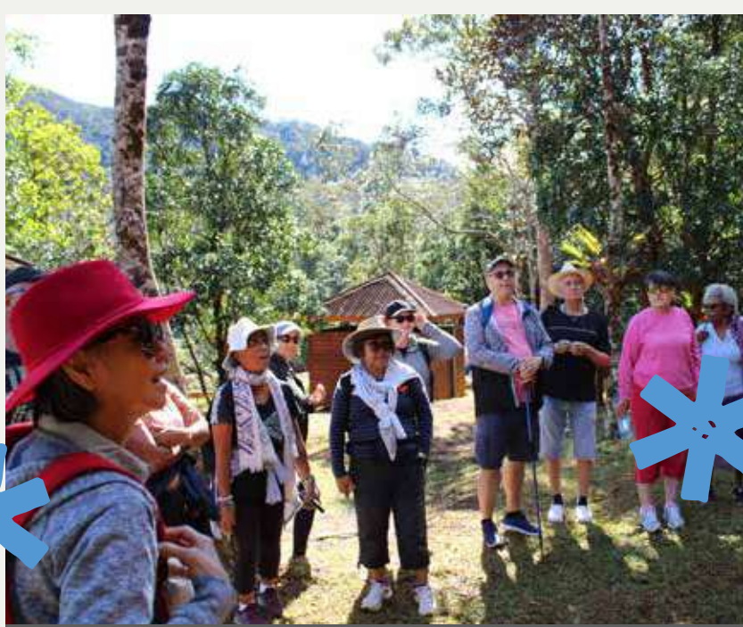
30 juillet - Sortie des seniors du centre communal d'action sociale à la Rivière Bleue