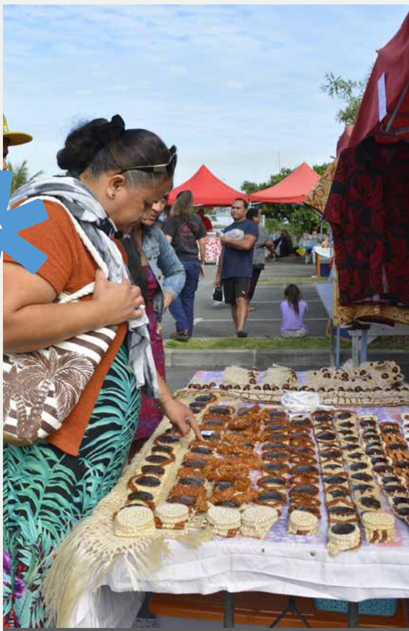
10 août - Marché spécial Wallis-et-Futuna au marché municipal