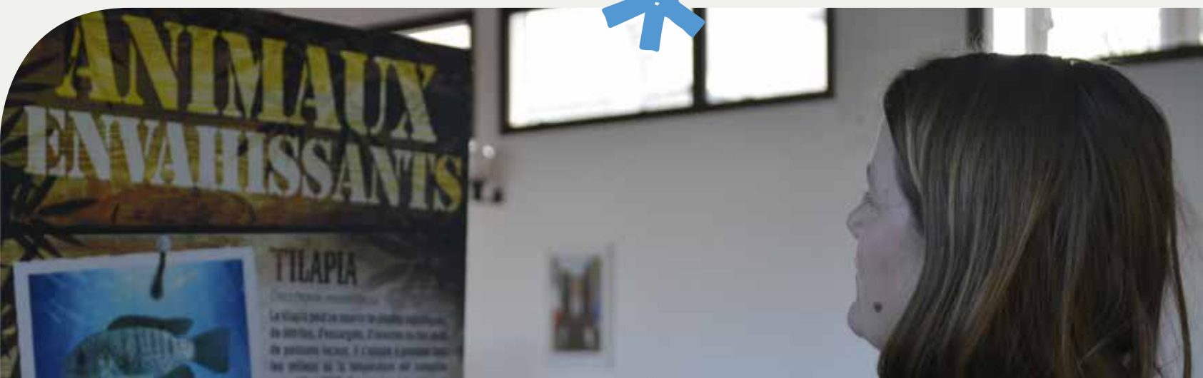
23 juillet - Exposition des espèces envahissantes à l'Hôtel de ville