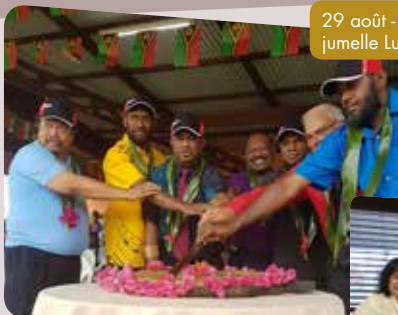
29 août - 43 e anniversaire de la ville jumelle Luganville, au Vanuatu