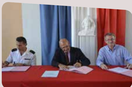
18 sept. - Signature du protocole Participation citoyenne à la mairie de Boulari