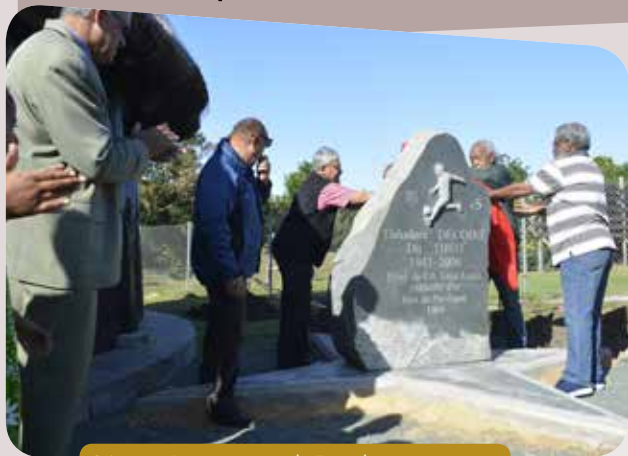
24 août - Dénomination du Faré des associations-Théodore Décoiré au Complexe culturel et sportif de Boulari