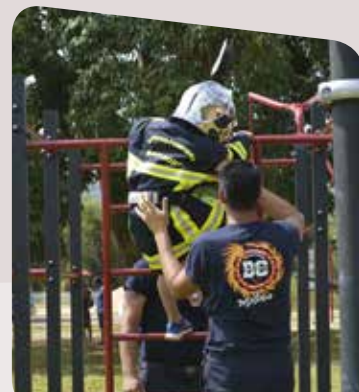
15 sept. - Journée récréative des pompiers au parc de La Coulée