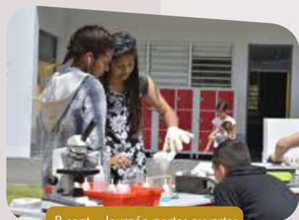
8 sept. - Journée portes-ouvertes au lycée du Mont-Dore