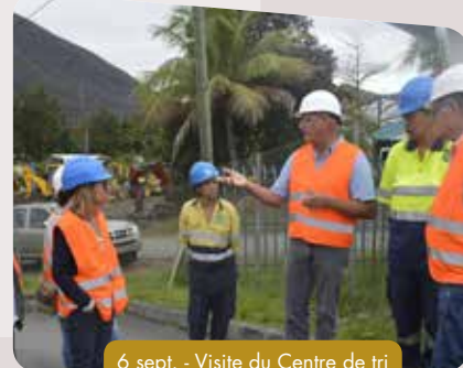
6 sept. - Visite du Centre de tri avec la GBNC et la SIEM