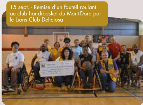
15 sept. - Remise d'un fauteuil roulant au club handibasket du Mont-Dore par le Lions Club Deliciosa