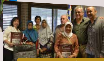
29 août - Rencontre entre des mamies indonésiennes et l'association Négropo