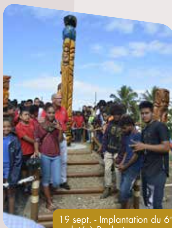
19 sept. - Implantation du 6 e poteau sculpté à Boulari