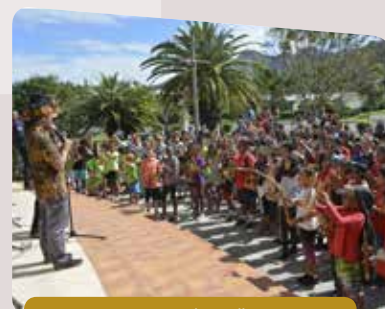
19 sept. - Concert d'Angkung par 300 écoliers, devant le Centre Culturel