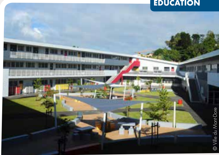
Une permanence d'inscription sera assurée jeudi 8 février au secrétariat de l'établissement (tél. 45 48 44).

L'internat ouvrira ses portes avec 100 places disponibles, dont 50 pour les filles et 50 pour les garçons. Les internes inaugureront des chambres de 3 à 8 places, comprenant des box séparés pour préserver l'intimité de chacun, ainsi que des toilettes, douches et des espaces de travail individuels ou communs.