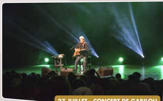
27 JUILLET - CONCERT DE GABILOU POUR LES SENIORS AU CENTRE CULTUREL DU MONT-DORE