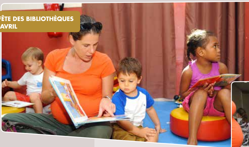
LE FÊTE DES BIBLIOTHÈQUES 23 AVRIL