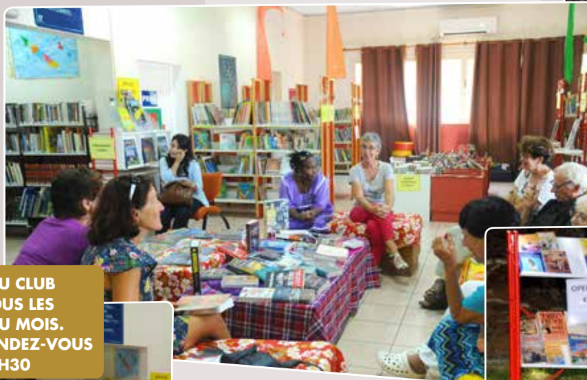
LANCEMENT DU CLUB DE LECTURE TOUS LES 2 ES SAMEDIS DU MOIS. PROCHAIN RENDEZ-VOUS LE 21 MAI À 9H30