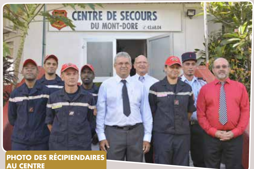
PHOTO DES RÉCIPENDIAIRES AU CENTRE