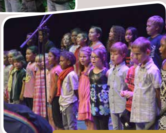
23 NOVEMBRE LA CHORALE DE TÉVITA