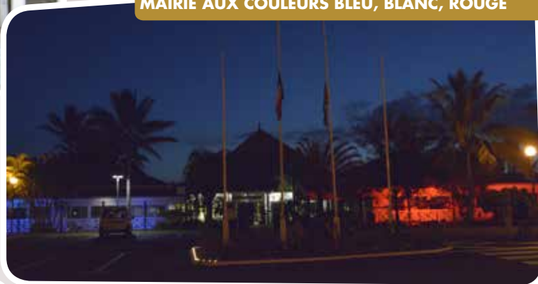
16 NOVEMBRE - EN MÉMOIRE AUX VICTIMES LA MAIRIE AUX COULEURS BLEU, BLANC, ROUGE