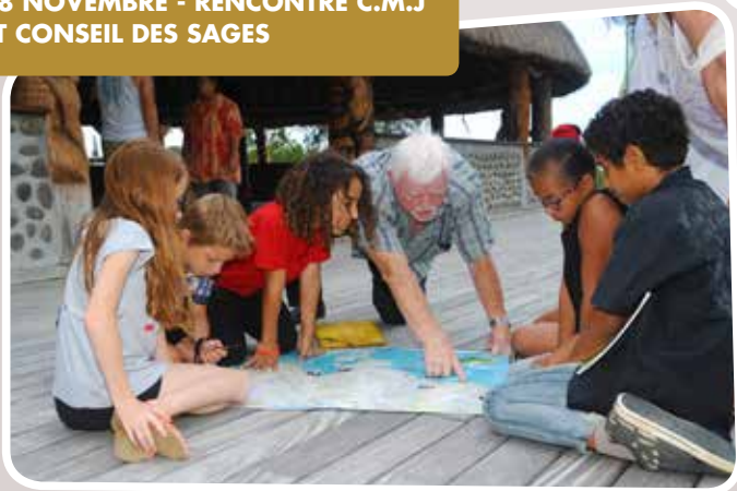
18 NOVEMBRE - RENCONTRE C.M.J ET CONSEIL DES SAGES