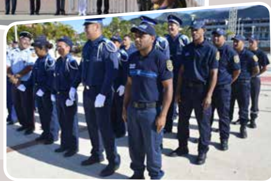
16 NOVEMBRE - EN MÉMOIRE AUX VICTIMES LA MAIRIE AUX COULEURS BLEU, BLANC, ROUGE