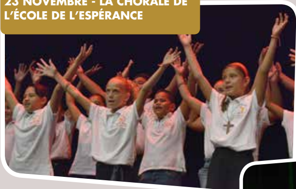
23 NOVEMBRE - LA CHORALE DE L'ÉCOLE DE L'ESPÉRANCE