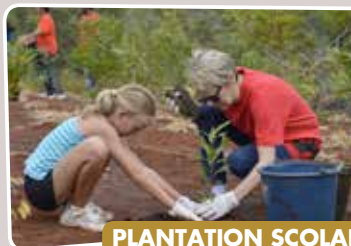
PLANTATION SCOLAIRE À LA COULÉE