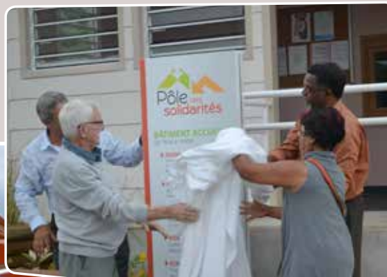
INAUGURATION DU PÔLE DES SOLIDARITÉS PAR MR LE MAIRE EN PRÉSENCE DES ÉLUS ET DES ADMINISTRÉS