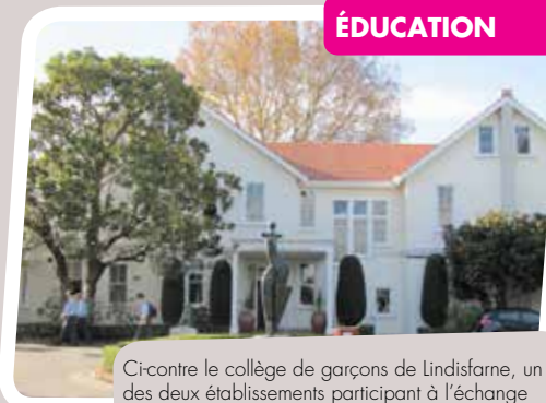
Ci-contre le collège de garçons de Lindisfarne, un des deux établissements participant à l'échange linguistique