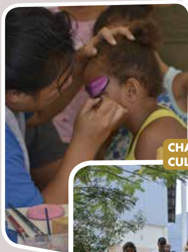
CHASSE AUX OEUFs AU CENTRE CULTUREL DU MONT-DORE