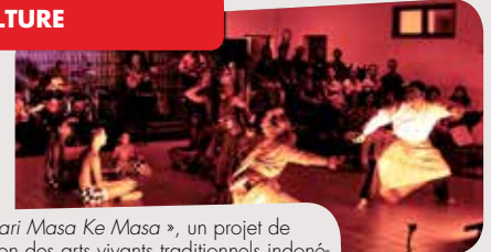
« Dari Masa Ke Masa », un projet de fusion des arts vivants traditionnels indonésiens et des pratiques culturelles modernes.