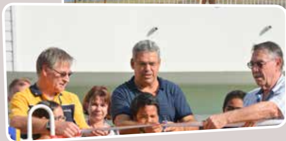
AQUA'STIQUE - 17 AVRIL 2014