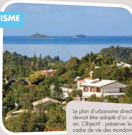
Le plan d'urbanisme directeur devrait être adopté d'ici un an. Objectif : préserver le cadre de vie des montdoriers.

Reste encore à peaufiner le projet et à le soumettre aux enquêtes administratives et publiques obligatoires. D'ici un an, le nouveau PUD du Mont-Dore pourra ainsi être approuvé par le conseil municipal du Mont-Dore, puis par le président de la Province Sud. ■