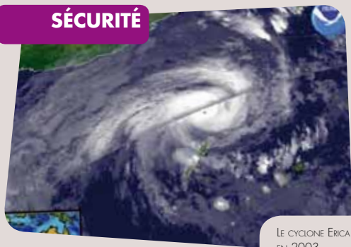
LE CYCLONE ERICA EN 2003