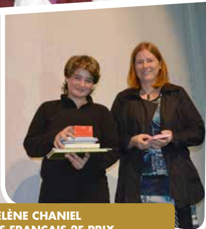
ECOLE HÉLÈNE CHANIEL PONT DES FRANÇAIS 2E PRIX