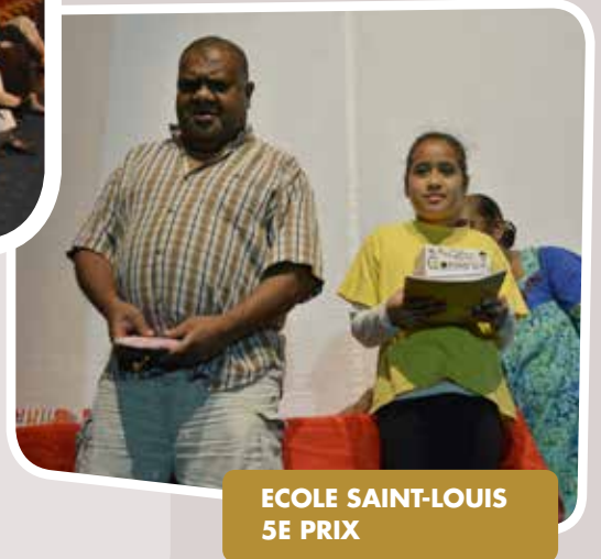
ECOLE SAINT-LOUIS 5E PRIX