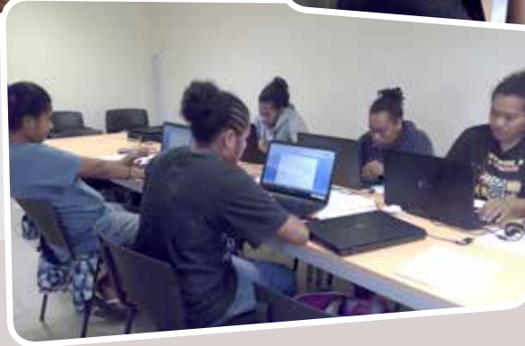
REMISE DES PRIX LE 26 AOÛT 2015 « DIS MOI DIX MOTS DE CHEZ NOUS »