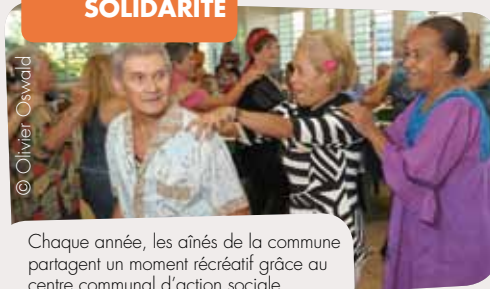
Chaque année, les aînés de la commune partagent un moment récréatif grâce au centre communal d'action sociale.