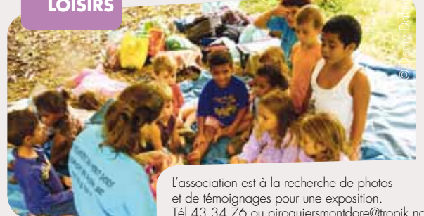
L'association est à la recherche de photos et de témoignages pour une exposition. Tél. 43 34 76 ou piroguiersmontdore@tropik.nc