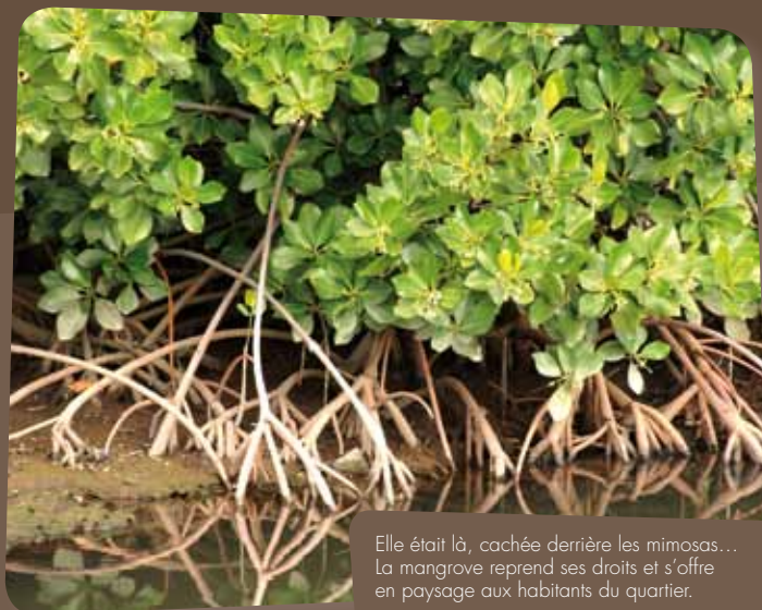
Elle était là, cachée derrière les mimosas... La mangrove reprend ses droits et s'offre en paysage aux habitants du quartier.