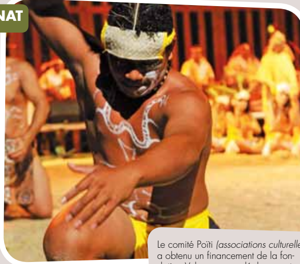
Le comité Poïti (associations culturelles) a obtenu un financement de la fondation Vale pour son déplacement au festival des arts des îles Marquises.

La Fondation d'entreprise de Vale Nouvelle-Calédonie, créée en août 2011, a pour mission de soutenir les projets socio-culturels, environnementaux et économiques dans le Grand Sud. Une opportunité à ne pas laisser passer.