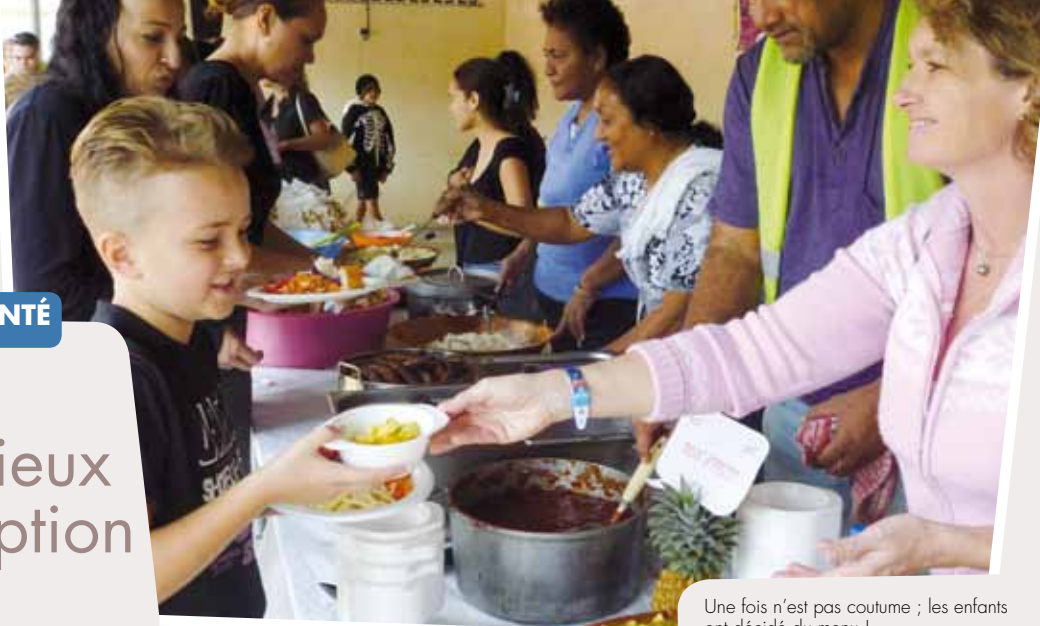
Une fois n'est pas coutume ; les enfants ont décidé du menu !

Depuis le début de l'année, l'école Saint-Joseph de Cluny regarde dans son assiette. Plus de légumes, moins de sucre, les enfants ont tout compris et montré à leurs parents comment préparer un repas équilibré. Bon appétit !