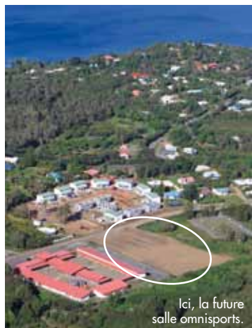
Ici, la future salle omnisports.

Après les travaux de fondation et de gros œuvre entamés en juillet, la construction de la salle omnisports, située à côté de l'école La Briquetterie, devraient commencer. Livraison prévue juillet 2012. Coût : 300 millions de francs.