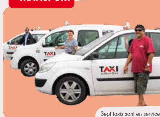
Sept taxis sont en service.