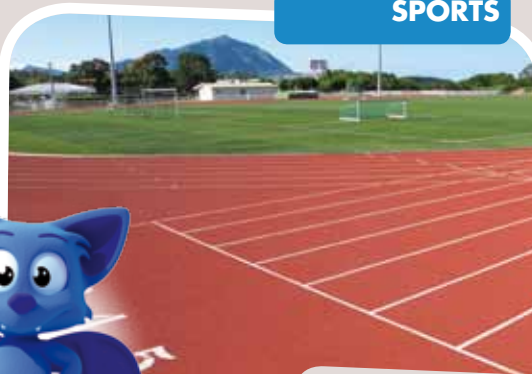
Le stade Boewa refait à neuf accueillera matchs de poule, demi-finales et petites finales dès le 27 août.