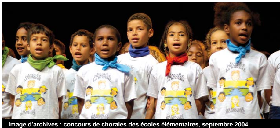
Image d'archives : concours de chorales des écoles élémentaires, septembre 2004.

« La réussite éducative passe par un équilibre familial, un enseignement qui donne à chacun la chance de réussir et une société capable de s'adapter pour que chaque jeune puisse trouver sa place. À l'école, le sport mais aussi les arts plastiques sont reconnus comme étant essentiels à la construction d'un enfant. Au Mont-Dore, nous souhaitons aller plus loin. C'est pourquoi, nous venons de lancer en test dans deux écoles, un programme d'éducation musicale, basé sur un projet pédagogique préparé en concertation avec les directeurs d'école, les enseignants, les intervenants spécialisés et les parents d'élèves. L'objectif que nous nous sommes fixé est d'aboutir à la pratique d'un enseignement collectif de la musique dans toutes les écoles primaires de la ville d'ici trois ans. Au final, des passerelles seront créées avec l'école des Arts. La musique met l'âme en harmonie avec tout ce qui existe, disait Oscar Wilde ! »