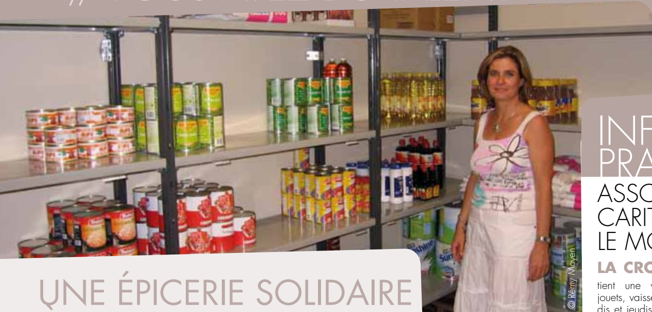
La nouvelle épicerie solidaire, gérée par Saint-Vincent-de-Paul sera l'occasion de relancer des ateliers culinaires pédagogiques dans la cuisine attenante au local (photo d'archives, épicerie du CCAS, 2009).