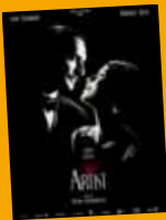
// MARDI 19 JUIN THE ARTIST De Michel Hazanavicius COMÉDIE DURÉE : 1h40