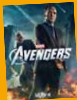
// MARDI 14 AOÛT THE AVENGERS De Joss Whedon ACTION DURÉE : 2h20

DANS LE CADRE DU FESTIVAL DU CINÉMA DE LA FOA