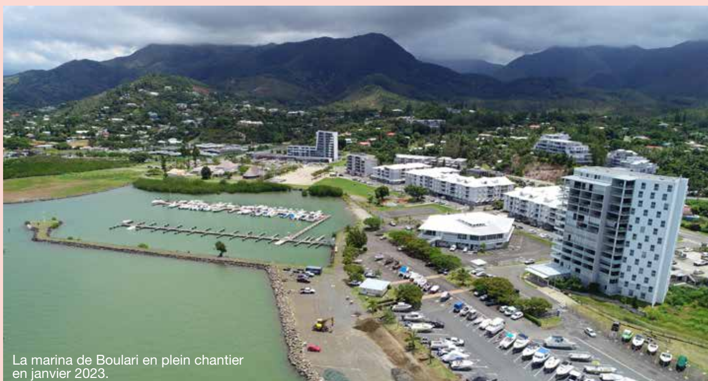
La marina de Boulari en plein chantier en janvier 2023.

Des projets sont en cours et à venir à Boulari. Ils doivent contribuer à pérenniser l'attractivité du centre-ville, offrir encore plus de services aux administrés et créer une identité mondorienne.