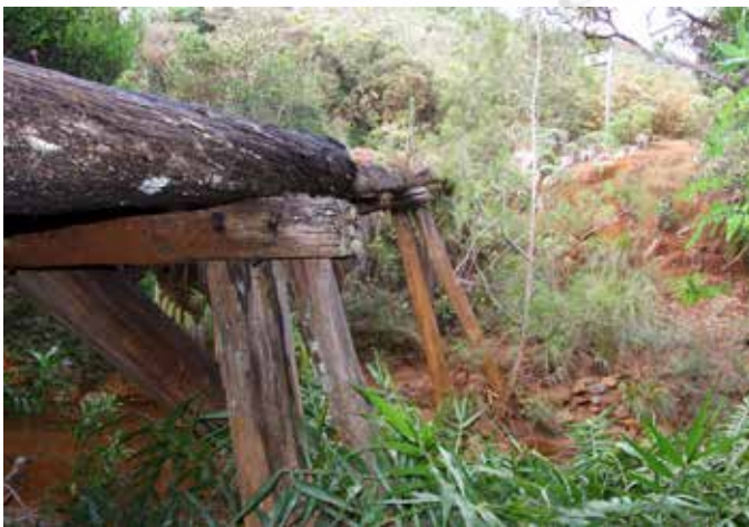
Vestiges du pont en bois de la mine Pasteur en 1894.