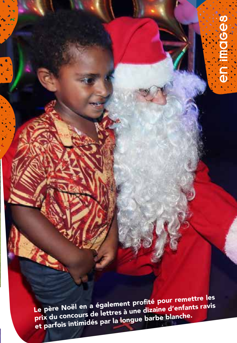
Le père Noël en a également profité pour remettre les prix du concours de lettres à une dizaine d'enfants ravis et parfois intimidés par la longue barbe blanche.