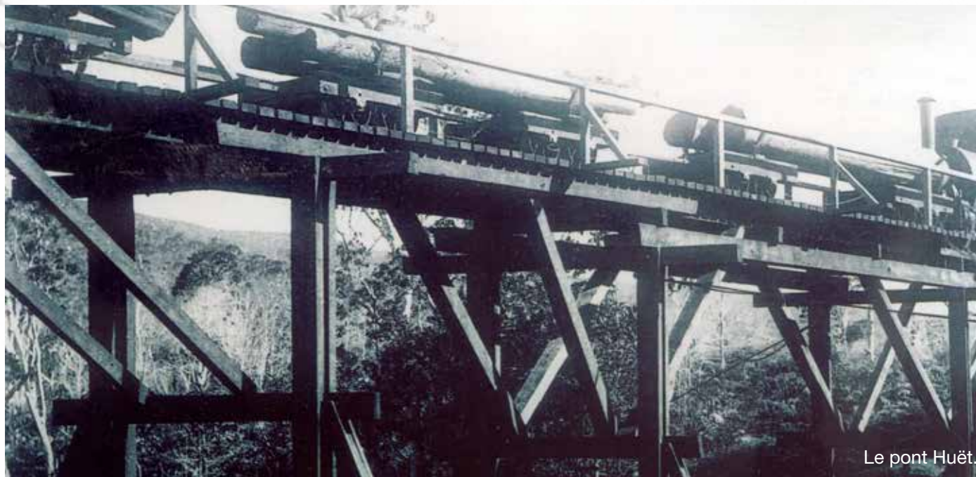
Le pont Huët.

Situé entre Plum et Port-Boisé, le Grand Sud est le quartier le plus étendu du Mont-Dore, avec Port-Boisé, Prony ou encore la Rivière des Pirogues, dont une partie de l'histoire a été précédemment racontée. Ce second volet sur la Rivière des Pirogues évoque les anciens ouvrages de travaux publics à l'origine du développement économique de l'extrême Sud calédonien.