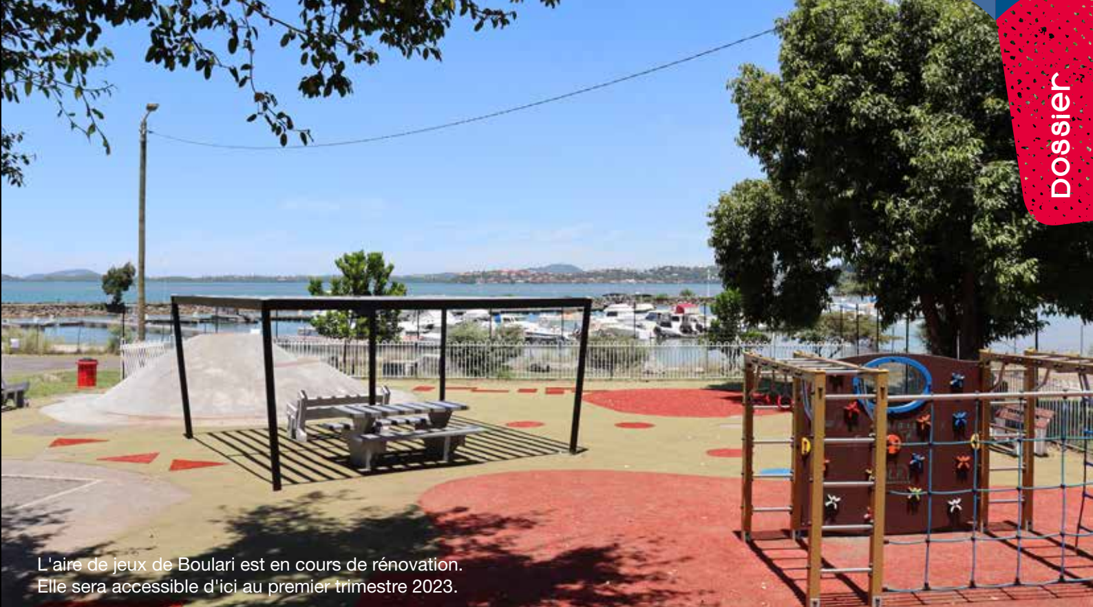
L'aire de jeux de Boulari est en cours de rénovation. Elle sera accessible d'ici au premier trimestre 2023.

sur la mer. La seconde, en cours, va concerner le revêtement et le marquage au sol. Sont également prévus, des aménagements, des espaces verts et des travaux d'éclairage. La fin de l'ensemble des travaux est également annoncée à la fin du premier trimestre 2023.