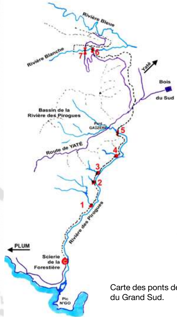
Carte des ponts de bois du Grand Sud.