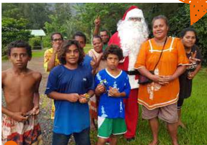
Tout au long du mois de décembre, et malgré quelques intempéries, le père Noël a effectué sa tournée dans les quartiers de la commune pour le plus grand bonheur des enfants !