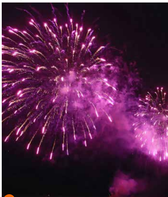
La soirée s'est terminée par un superbe feu d'artifice.