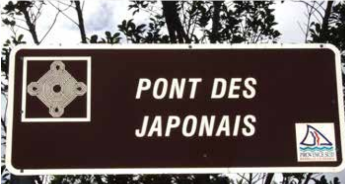
La pancarte du pont dit des Japonais.