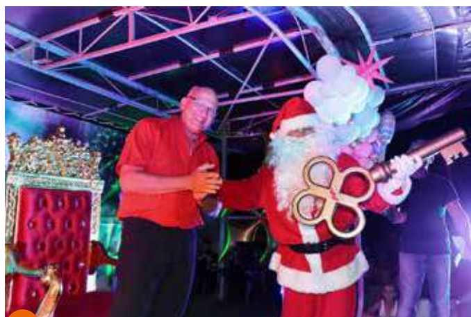
...l'arrivée très attendue du bonhomme vêtu tout de rouge ! Devant une foule nombreuse, le Maire a remis les clés de la Ville au père Noël qui a ainsi pu déposer les cadeaux dans les maisons des Mondoriens.