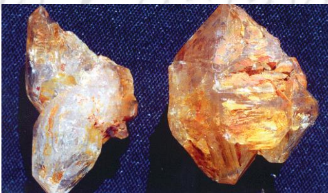
Cristal de roche bi-pyramidé provenant des hauts de Saint-Michel.

En 1873, il obtient une concession à Boulari pour y construire la première briquetterie « civile ou libre » de Nouvelle-Calédonie (d'autres briques sont fabriquées par l'armée et l'Administration pénitentiaire). Sa famille est alors la seule à occuper les terres entre La Conception et Saint-Louis. L'habitation comprend une cuisine, une écurie et quatre hangars de séchage des briques. Celles-ci étaient moulées et estampillées avant d'être cuites au four à 1 200 °C. Le briquetier pourrait avoir choisi ce lieu isolé, à 12 km de Nouméa, car, en 1854, la corvette Prony avait extrait à cet endroit 6 tonnes de charbon pour alimenter ses chaudières. Ce gisement pouvait donc servir à cuire des briques. Il trace un chemin d'accès au bord de mer de près de 2 km et construit un débarcadère permettant de charger les briques sur des chalands en direction de la « Capitale ». Elles sont également tirées par des bœufs ou des chevaux vers La Conception et Saint-Louis où la mission construit à tour de bras.