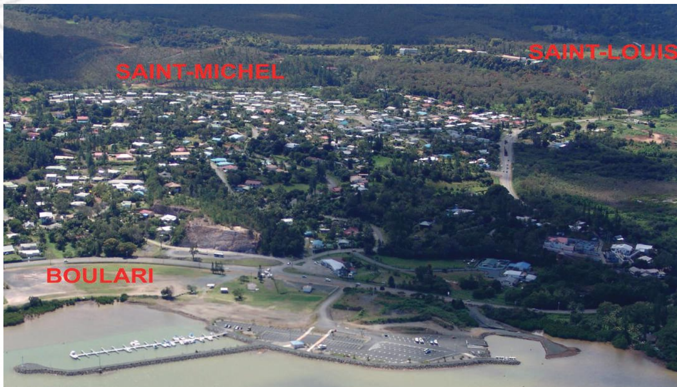
Vue du quartier de Saint-Michel avant l'aménagement du front de mer.

Sixième quartier que l'on rencontre sur la route de Pont-des-Français à Saint-Louis, Saint-Michel est aussi la dernière région à avoir connu un démarrage économique. Aujourd'hui largement urbanisé, il héberge une population d'une grande diversité ethnique. Ces terres autrefois marécageuses étaient occupées par un briquetier.